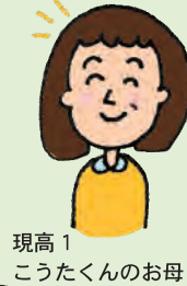
現高1 こうたくんのお母さん

中学校からの英語に備えて英会話を習わせていました。算数が苦手だったので、算数だけでなく塾よりも家庭教師！と思い、ネットで調べて入会。体験で、英語は会話だけではなく、文法もやっておかないといけなくなると言われ、英語と数学の予習をお願いしました。いざ中学の授業に入ってみて、やってよかったと娘が言っています。