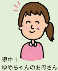
現中1 ゆめちゃんのお母さん

現在指導中の生徒さんのお母様から頂いた貴重なご意見の一例です。このご意見が私達の財産です！